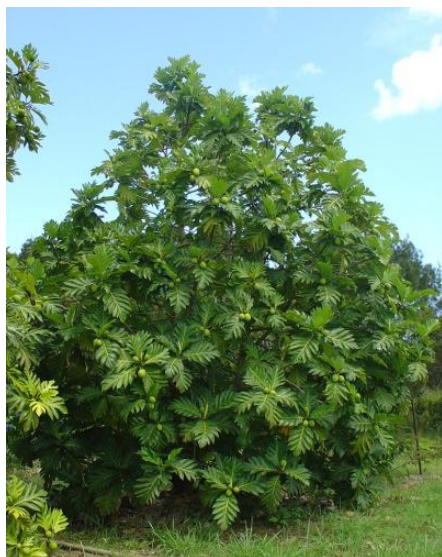
Arbre à pain adulte avec fruits (variété Ma'afala )

La fiche ci-dessous présente les propriétés et usages médicinaux des différentes parties de la plante .