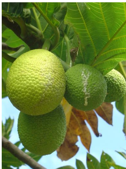
Fruits à pain sur arbre (variété Ma'afala)