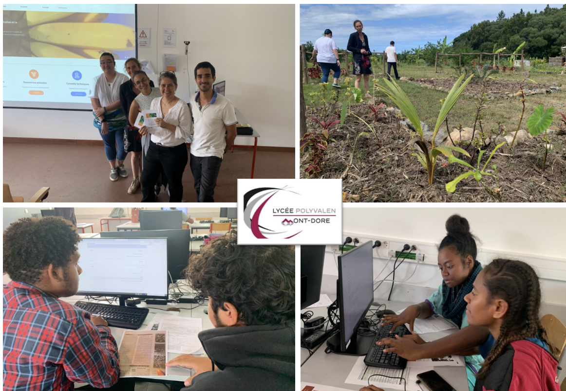
Collaboration du CAP agricole du Mont Dore à Agripedia