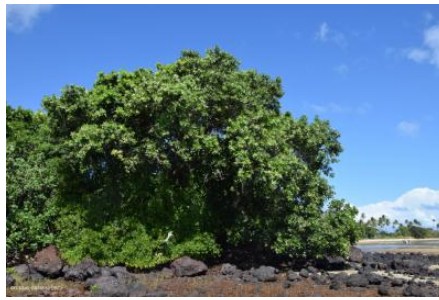
Tamanou (arbre) sur l'île d'Art (Belep)