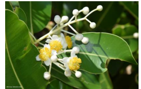
Fleurs de Tamanou, île d'Art (Belep)