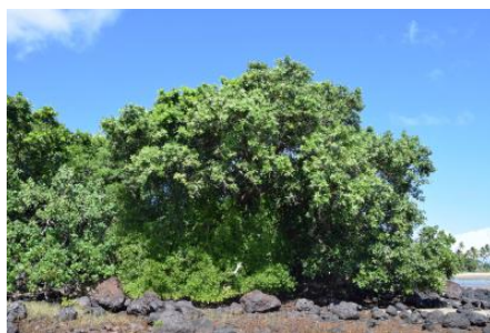
Tamanou (arbre) sur l'île d'Art (Belep)