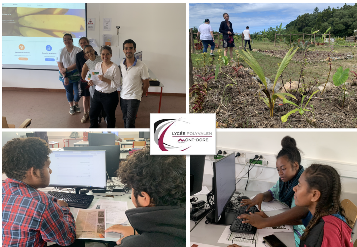
Collaboration du CAP agricole du Mont Dore à Agripedia

Lors des ateliers de travail, les élèves ont appris à rechercher des informations sur le tamanou et ont intégré ces informations via le backoffice d'Agripedia. Merci à eux !