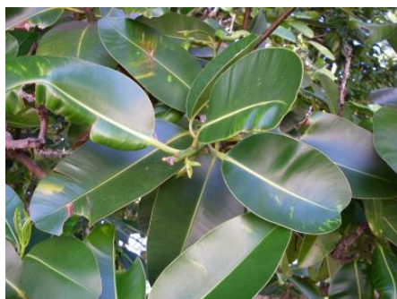
Feuilles de tamanou