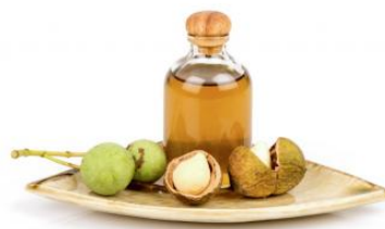
Huile extraite du Tamanou