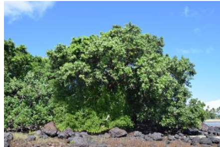
Tamanou (arbre) sur l'île d'Art (Belep)