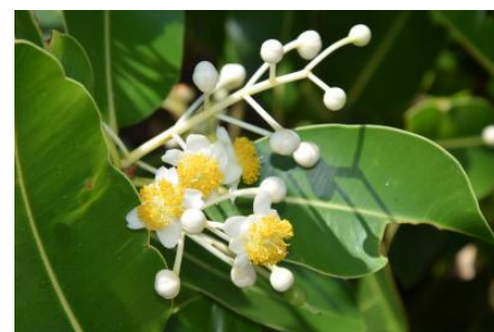
Fleurs de Tamanou, île d'Art (Belep)