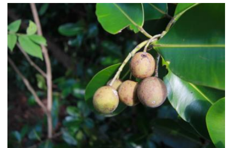
Fruits mûrs de Tamanou