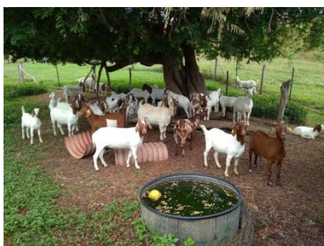
Troupeau caprin