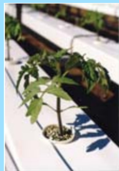
Plant de tomate hors-sol