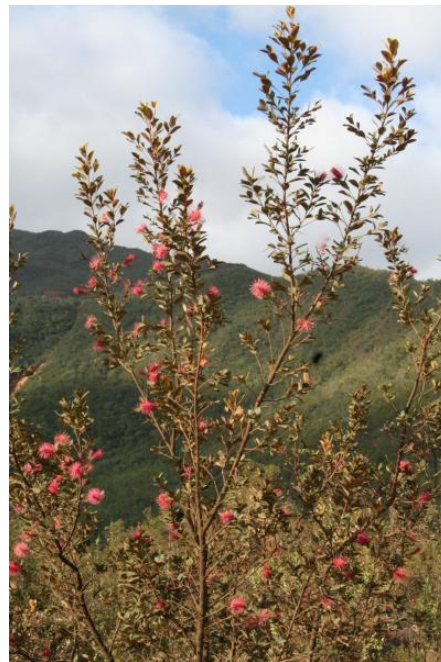
Grevillea gillivrayi en fleur