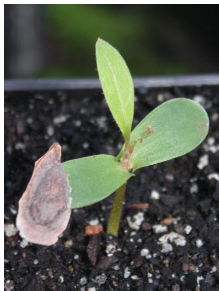
Plantule de Grevillea gillivrayi

Cette espèce peut se multiplier par bouturage .