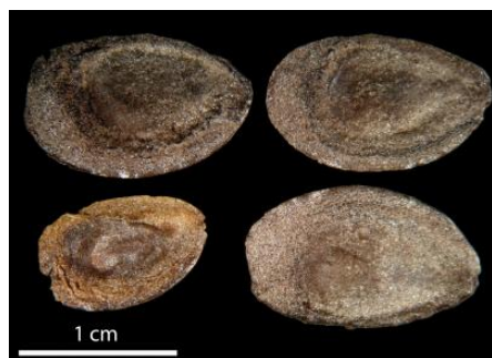
Graines de Grevillea gillivrayi