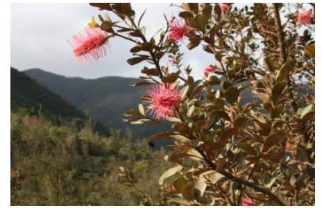
Grevillea gillivrayi en fleur