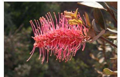
Inflorescence et feuilles de Grevillea gillivrayi