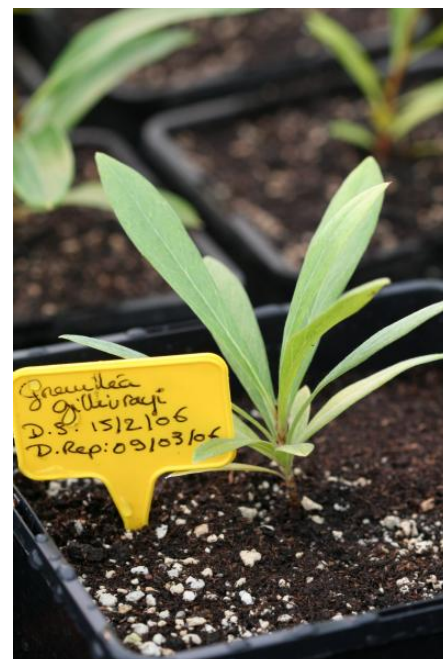
Jeune plant de Grevillea gillivrayi