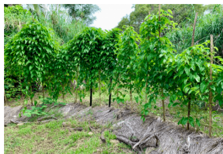
Plants d'ignames, Centre Tjibaou, Nouméa