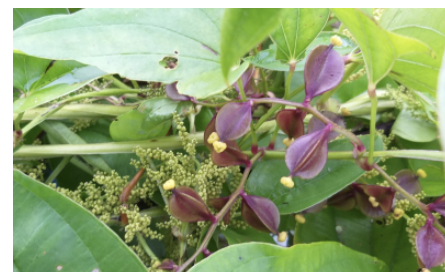
Fleurs femelles (mauves et jaunes) et fleurs mâles (petites et jaunes) de l'igname D. alata