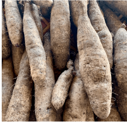
Ignames ( D. Alata ), marché Nouméa juillet 2024