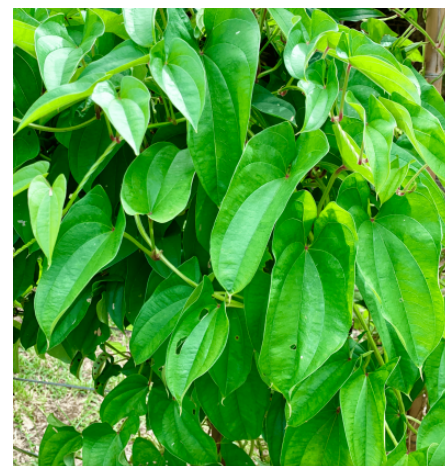
Feuilles d'igname