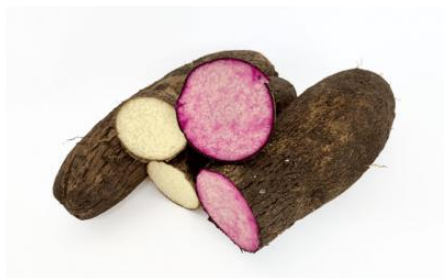
Ignames D. alata, Nouvelle-Calédonie. Leurs formes, tailles et couleurs sont variées