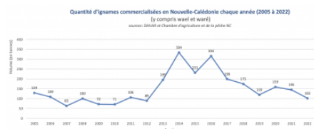
Quantité d'ignames commercialisées en Nouvelle-Calédonie entre 2005-2022, source Davar et CAPNC

Entre les années 2005 et 2016, la production et quantité d'ignames commerciales a connu une forte croissance , puis elle a connu une forte baisse jusqu'à atteindre 102 tonnes en 2022. Ces volumes ont atteint en moyenne 197 tonnes chaque année au cours de la décennie 2012-2022.