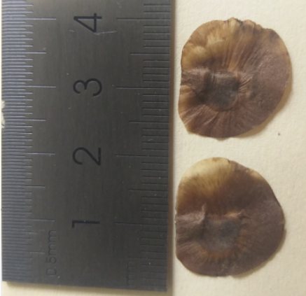
Les graines d'igname D. alata sont ailées et mesurent 1 à 1,5 cm