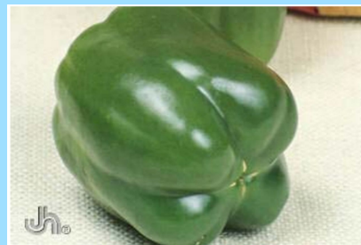
Types de Poivrons