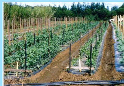
Plants de poivrons