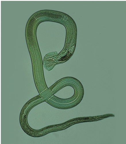
Trichostrongylus axei adulte