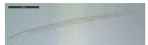
Larve L3 de Trichostrongylus